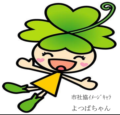
市社協イメージキャラクター よつばちゃん