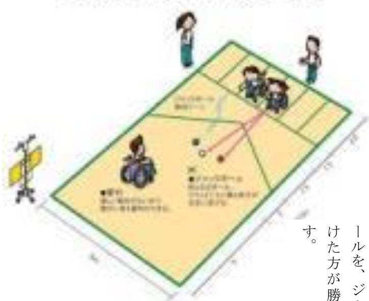
レクリエーションポッチャのコート図

目標となる白いボール(ジャックボール)をコートの中に投げ、赤と青それぞれ6個のカラーボールを、ジャックボールに近づけた方が勝ちというゲームです。