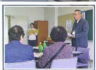
(国分寺公民館にて)