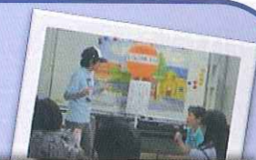
(特別支援学校保護者の皆さんを招いての講演会)