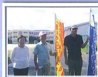
(国分寺台東小学校にて)