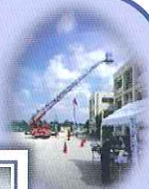
(国分寺台東小学校児童と地域が参加)