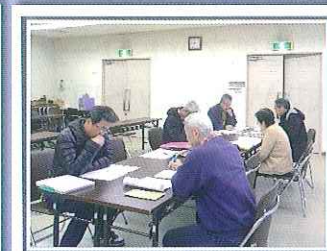
(社会福祉協議会の会議室にて)