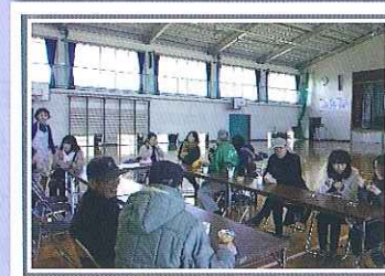
(国分寺台東小学校にて)