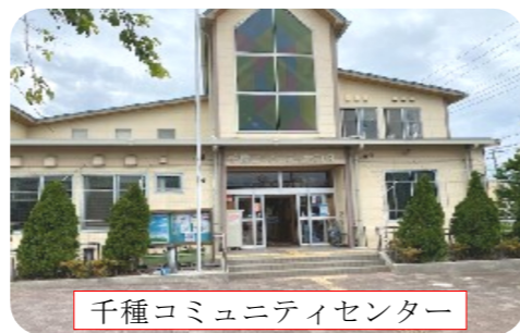
千種コミュニティセンター