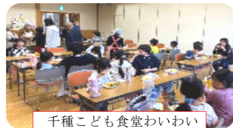
千種子ども食堂わいわい

また、いろいろな方々と協力して子供向けの活動も活発化させております。姉崎の「げんき食堂アネッサ」につづき、地域食堂「わいわい」も5月から立ち上げました。子どもたちが元気に遊び、たくさん食べるのを見るのは張り合います。