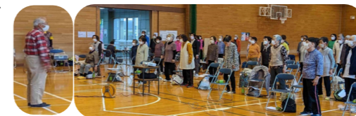
体育室でのサロン

姉崎公民館とアネッサの2会場開催の茶話会を、共生型サロンとしてアネッサに集約し、(仮称)「集いの場アネッサ」を開催しています。