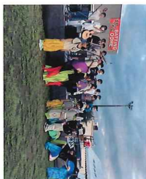
最後に記念撮影「はいチーズ」

今年から開催時間を1時開始となりました。子どもたちが集まり、待ちきれない様子。フラインクスキャンディや飲料水、小物やキッズフリーマーケット、ゲームコーナーには早々とカートなど前年に引き続き会場が華麗なパフォーマンスを披露、大いなる喝采を受けていました。