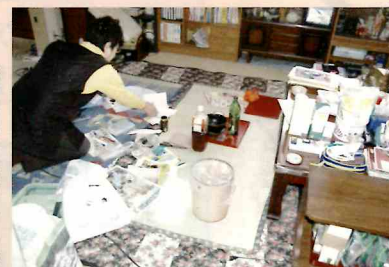
部屋の片付け・掃除