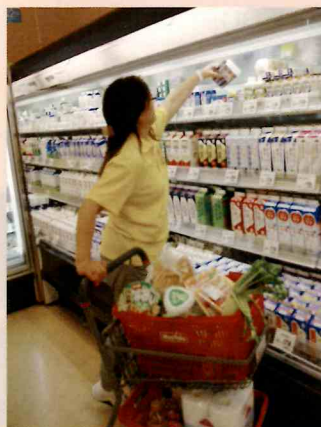
買物代行 おまかせくん

会員は、利用会員108名、協力会員23名、賛助会員88名（令和2年3月現在）。令和元年度の日常生活支援活動は、2,255時間になるニャン