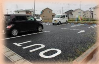
外観 (駐車場より見た風景)